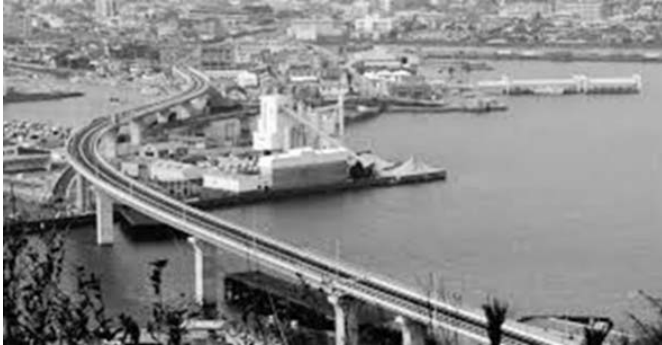
天草未来大橋 (R5.2.25 開通)

天草大会では、スローガンに『ウィズコロナ』のもと新しい育成会活動を天草から」と掲げ、ウィズコロナの時代にあっても育成会活動を通じて周りの人々を巻き込みながらつながりを感じることができる地域づくりを天草から発信します。多くの会員の参加をお待ちしています。