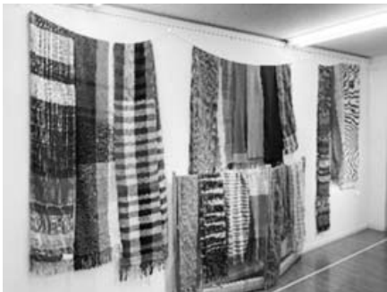
さをり織りの作品

山鹿ゆうあい園は、山鹿市にある地域活動支援センターです。当事業所は、平成18年9月にNPO法人として設立され、今年で17年目になります。