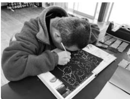
スクラッチアート製作

さらに、全員で取り組む活動として、芋植え、玉ねぎ・芋の収穫、アルミ缶回収整理、調理実習、ホウ酸団子づくりなどがあります。