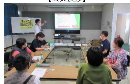
【本人部会：意見発表】