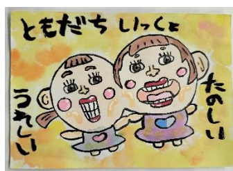
【天草白い雲の会会長賞】