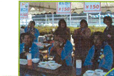
たくさんのボランティア・保護者の方にご協力いただきありがとうございました