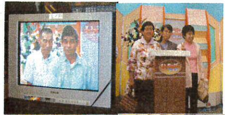
NHK宮崎放送局番組の収録撮影と見学