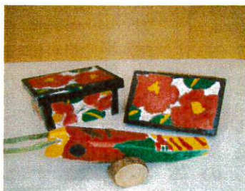
人吉の郷土玩具 花手箱・きじ馬の絵付け

7月24日、育成会県大会が人吉市カルチャーパレス、石野公園で行われました。本人部会では、多くの仲間や高校生ボランティアの人達と歌を歌ったり、歌に合わせて体を動かしたり、本の読み聞かせがあったりと楽しい時間を過ごしました。その後は、石野公園にて陶芸、郷土玩具(きじ馬・花手箱)、竹とんぼ・紙すきにチャレンジ!個性あふれる作品ができました。