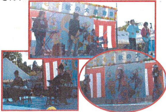
琴の演奏・ハワイアン・小中学生バンドなど全10グループの皆さんがステージを盛り上げてくれました!