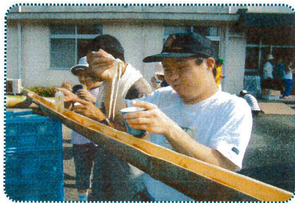
流れてくるそうめん集中