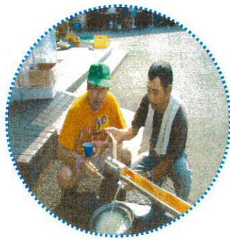
一番下でたまったそうめんを食べます らくちんらくちん!