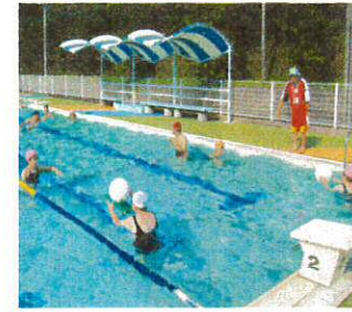
楽しく、気持ちよく ダイエット!?