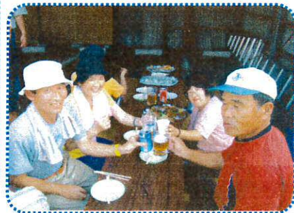
生ビールとジュースで乾杯!