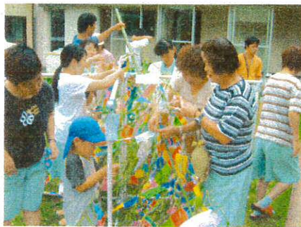
豊福保育園の子供たちと一緒に 飾りつけをしました

七月一日、今年もまた一年に一度訪れるかわいい子供たちとともに七夕飾りをしました。互いに協力しながらたくさん飾りをつけ、りっぱな笹となりました。