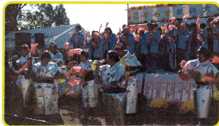
オープニングはこすもす園利用者のマツケンサンバII♪

11月20日、「こすもす秋の大感謝祭」を行いました。とてもよい天気にも恵まれ、多数の来場者とともに、ステージイベントや食品バザー、フリーマーケット、大抽選会など、大盛況でした。ステージイベントでは、合唱、バンド・琴演奏、踊り、ひまわり保育園・豊福保育園の出し物などで盛り上がりました。ちなみに今年の抽選会の特賞は、デジカメ&プリンターでした。