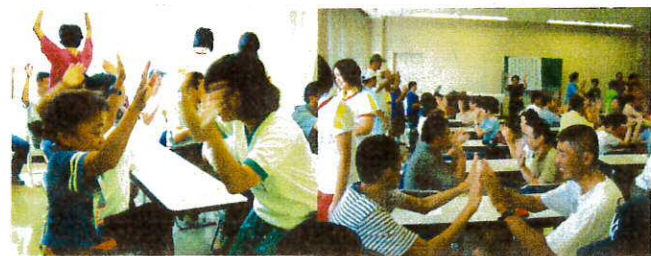
ボランティアの方とも 仲良くなりました