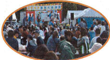
町内外より多数のお客さんに来ていただきました

今後も、地域の方々との交流の機会を少しでも多くつくっていかれたらと考えています。