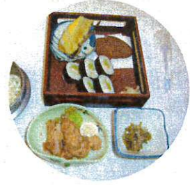
宮崎名物 チキン南蛮&レタス巻き

10月6、7日、宮崎旅行に行ってきました。初日はあいにくの天気、生駒高原の満開のコスモスも遠くから眺めるだけでした。昼食は、宮崎名物のチキン南蛮にレタス巻き。