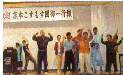
熊本こすもす園御一行様

レタス巻きは宮崎が発祥の地だとか！NHK宮崎放送局では、夕方番組の収録を行いました。3グループに分かれ約1分ほどのPRをし、夜の宴会時に皆で観賞しました。自分達の姿をテレビで見るとは不思議な感じ。NHKの後は、フェニックス動物園へ行き、タイからやってきたアジアゾウの芸を見ました。宿泊地の宮崎グランドホテルでは、温泉にのんびり入り、ごちそうを食べ、マジックショーやゲーム、カラオケなどで盛り上がりました。