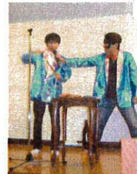
即席コンビ!?によるマジックショー 歌って踊って大騒ぎ!