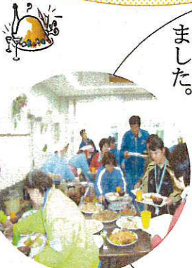
どれにしようか悩むな～

12月22日、ランチバイキングを行いました。たくさん料理の中から好きなものをお腹いっぱい食べました。さらにクリスマスにちなみ、ちよっとしたケーキバイキングもありました。