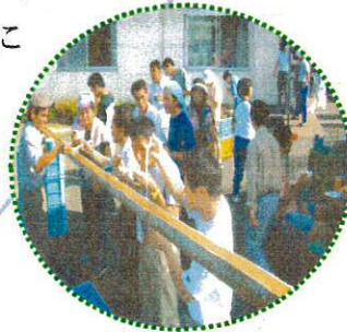
上の人が取ってしまう~

夏の恒例行事!今年も「納涼そうめん流し」を行いました。手作りのそうめん流しセットを組み立て、竹の香り漂う中、そうめんが次々流れてきます。皆、必死になって流れてくるそうめんをつかみ口の中へ。中には1本しか取れない方もいて、何度もチャレンジ!夏の暑さを少しだけ忘れられたひとときでした。