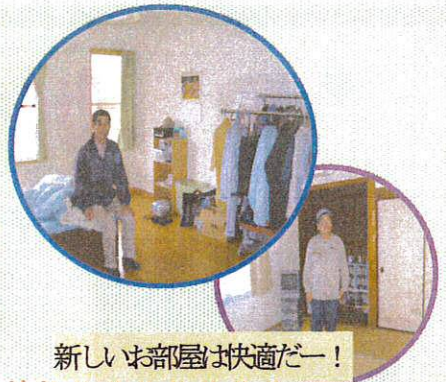
新しいお部屋は快適だー!

このような状況の中で、自立支援法が施行され、法の基本理念に沿って、地域生活移行に本格的に取り組み、毎年度グループホームを開設し、20年4月現在、4ヶ所・15名の皆さんが地域での生活を楽しんでおられます。このことで、当面の目標であった指定管理者制度の指定条件である施設体系の再編も完了し、