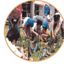
一緒に協力して飾りつけをしました

7月1日、豊福保育園の子供たちが来園し、一緒に七夕飾りをしました。短冊に書いた願いは叶うでしょうか?