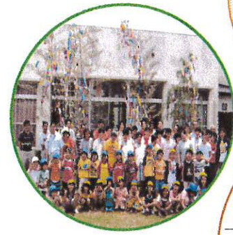
子供たちが七夕の歌と飾りをプレゼントしてくれました

7月1日、豊福保育園の子供たちが来園し、一緒に七夕飾りをしました。短冊に書いた願いは叶うでしょうか?