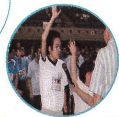
選手宣誓 緊張しながら頑張りました 開会宣言

7月5日、宇城上益城の輝き大会がありました。さまざまな競技に参加し、良きリフレッシュの1日となったことでしょう。