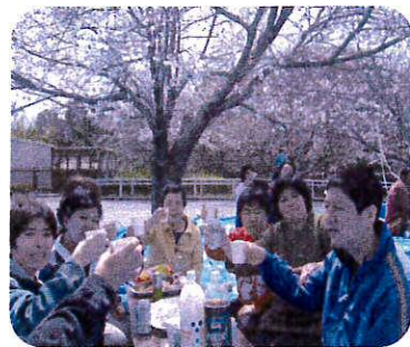
桜の木の下でかんばんーい!