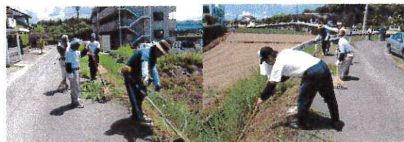
草を刈って集める。なかなか大変...

曲野台団地の自治会の依頼により、曲野台団地の除草作業を清掃班で行いました。真夏の炎天下の中、熱中症に気をつけながら頑張りました。この他にも、地域の民家の除草なども行いました。地域交流、貢献を目指して今後も頑張っていきます。