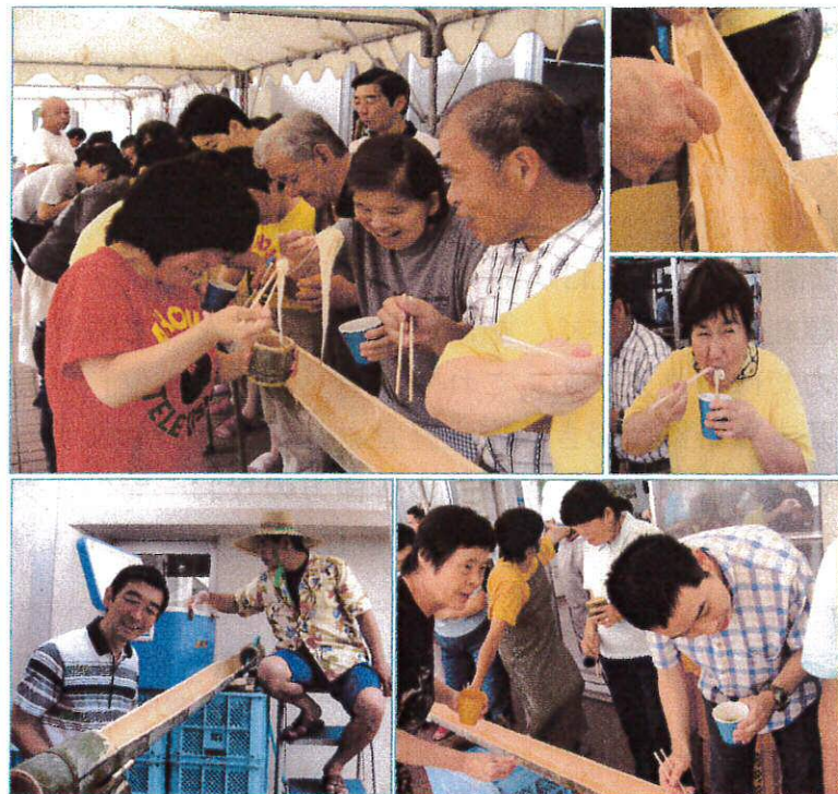
わーい。たくさんとれたよ！そうめんはおいしいな！ 新園長も初参加！奥の方は流しそうめんのプロ？

8月9日、夏の陽射しが照りつける青空の下、流しそうめんが行われました。同じ流しそうめんでも流れてくる流しそうめんは普段のものとは違うのか、皆、流しそうめんをつかむ楽しさ、食べる喜びを味わっていたようです。通所部のレクリエーションも同時に行われ、少しでも夏の暑さを忘れたひとときを送れたのではないのでしょうか。