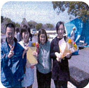
よい思い出に 写真撮影