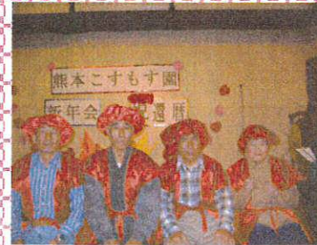
赤い衣装似合ってます