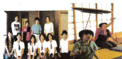
皆さんと一緒に 大小の皿に挑戦

地域行事にて、ボランティアや皿まわし等で活躍されている、松橋高校「ウキウキレオクラブ」よりお誘いを受け、皿まわしの手ほどきを受けました。最初は苦戦しましたが、丁寧に教えていただいたおかげで徐々に回せるようになりました。今後もこのような交流が続いていくとよいと思います。