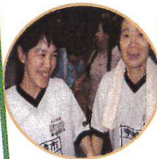
輪になって マイムマイム