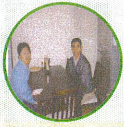
共有スペースで団欒

4月に4つ目のグループホーム「グループホームこすもすIV」ができました。IVは、割烹店の2階を改築した所に、男性5名が個室で生活しています。地域就労や通所利用など日々の生活はさまざまです。念願の地域での生活が楽しいものとなるよう今後も見守り、支援を続けていきます。