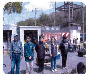
グループホームで生活します

4月から新たに職員2名が加わり、さらに明るく楽しいこすもす園になるよう皆で頑張っていきます。