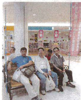
いろいろ買物したぞ

5月から8月にかけて、入所・通所それぞれ、買物やカラオケ、ボーリング、動植物園見学などに行きました。カラオケではダンスを交えておもしろい歌い、動植物園では、のんびり動物を見て、空中ブランコなどに乗ってはしゃぎました。昼食は、お店に入り、メニューを迷いながら決め、好きなものをおいしく食べました。日頃の仕事の疲れを癒し、ストレス発散、リフレッシュができました。