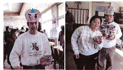
鬼のお面似合うかな?

1月15日、どんどやを行いました。雨が降りそうな天気でしたが、無事点火し、熱々のおもちや焼いもをおいしく食べました。