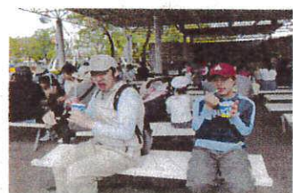
かき氷おいしかった

5月から8月にかけて、入所・通所それぞれ、買物やカラオケ、ボーリング、動植物園見学などに行きました。カラオケではダンスを交えておもしろい歌い、動植物園では、のんびり動物を見て、空中ブランコなどに乗ってはしゃぎました。昼食は、お店に入り、メニューを迷いながら決め、好きなものをおいしく食べました。日頃の仕事の疲れを癒し、ストレス発散、リフレッシュができました。