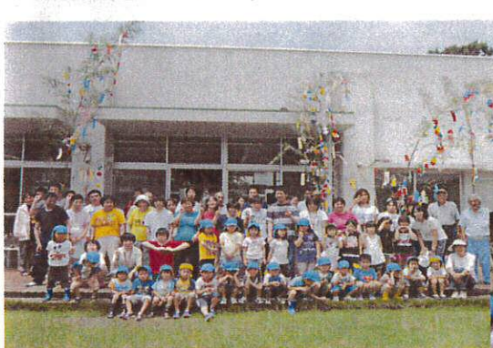
願い事叶うかなあ

7月5日、豊福保育園の子供たちと一緒に七夕の飾り付けを行いました。皆で力を合わせながらきれいに付けることが出来ました。子供たちから歌のプレゼントももらい、笑顔あふれる時を過ごしました。