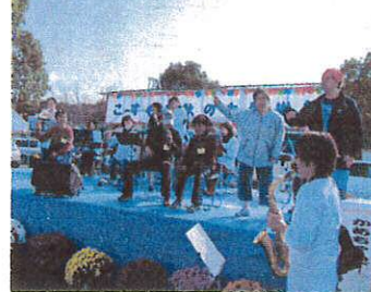
ステージも 大盛り上がりでした

11月23日、『こすもす秋の大感謝祭』を二年分の感謝の思いを込めて開催しました。前日は雨がやまず心配しましたが、当日は晴天! 気候も良く、気持ちいい日差しの中、食バザー、ステージ、フリーマーケット、抽選会など大盛況でした。家族の会、熊本学園大学あすなろう、NECロジスティックのみなさんなど多くのボランティアや出演者の方々に協力いただき、笑顔あふれる楽しい祭になりました。