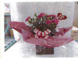
母の日ギフト クラフトバッグ &カーネーション