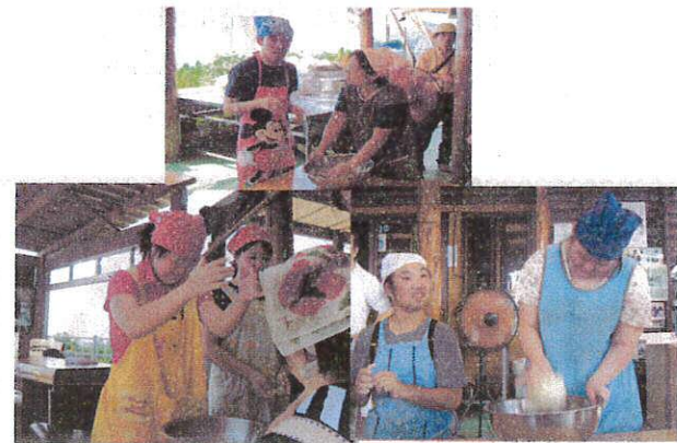
一生懸命こねて叩きつけて力仕事です