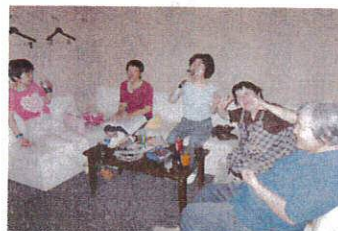
たくさん歌ったよ~