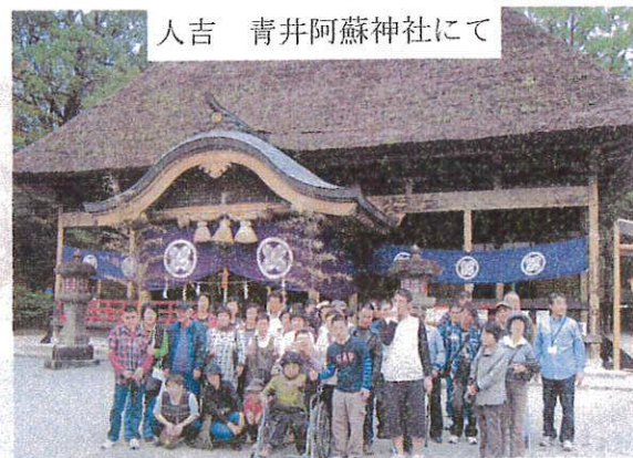
人吉 青井阿蘇神社にて

10月14、15日、一泊二日で霧島旅行に行ってきました。一日目は、青井阿蘇神社、コカ・コーラ工場、焼酎工場に行き、霧島国際ホテルに宿泊。二日目は、霧島高原まほろばの里、高千穂牧場に行き、人気のSL号としんべい号に分かれて乗車し帰ってきました。食べて飲んで、景色を楽しむ！ ゆっくりのんびり旅行でした。