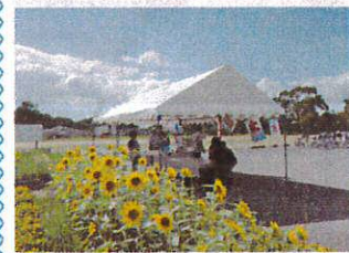
ひまわりも満開です