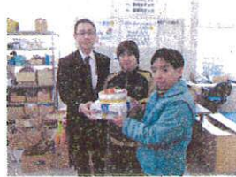
毎年ありがとうございます