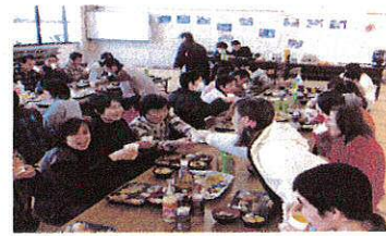
家族も方も一緒にカンパニー