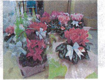
きれいな花に囲まれてクリスマス気分を味わいました

セットAはクラフトバッグにシクラメン、セットBはクラフトバッグにゴールドクレスト・プリンセチア・アリッサム。どちらも好評でたくさんの注文をいただき完売しました。