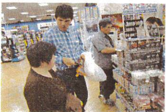
何を買うのか相談中かな?