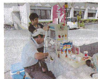
たくさん入れますよ

この夏、「かき氷」の販売を始めました。場所は、希望の里サンアビリティーズの駐車場やアグリパーク豊野、不知火プール等。作り方や接客の仕方など試行錯誤しながら頑張っています。