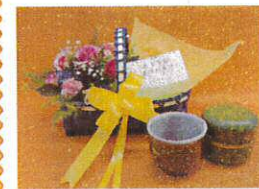
父の日ギフト クラフトバッグ &バラ&新茶& 湯のみ