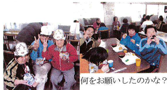
何を願ったのかな?