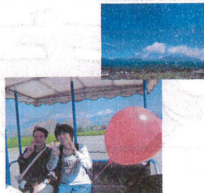
とってもいい景色でした