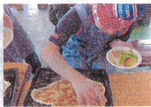
ピザのトッピング

9月18日、通所のレクレーションで三角町の宮田農園に行きました。とてもいい天気の中、見晴らしのいい山の中腹でピザ・パン・バームクーヘン・おにぎりを作りました。ピザ・パンは、みんなで交代でこねたり叩きつけたりしながら協力し合って生地から作りました。 美味しい空気とおいしい手作りランチをいっぱい食べ、満足な一日を過ごしました。