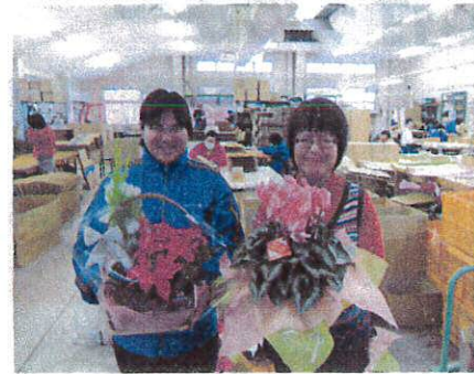
クラフトバッグ作り、ラッピング、配達大忙しでした