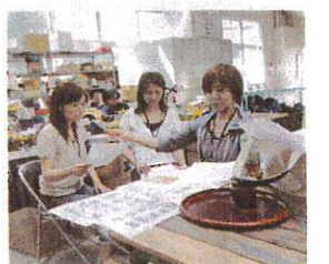
生ラジオ、ドキドキ

5月の母の日、6月の父の日に園の自主製品「クラフトバッグ」と他の商品をコラボしてギフトの販売をしました。販路探しやラッピング、フラワーアレンジメントなど初めてなことがばかり。それに加えて、FMK「オフィスデリバリー」、RKK「ミミー号」にラジオ出演し、生放送です。すもす園やギフトの宣伝をしました。今後も敬老の日などに向けてギフト商品を検討中です。