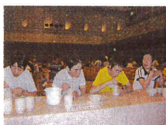
絵付け難しかった~