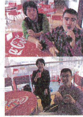
コーラおいしかったよ