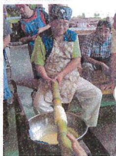
バームクーヘン作り 職人みた~い