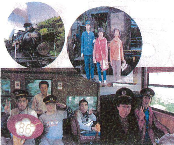
SL号にて車掌さん気分