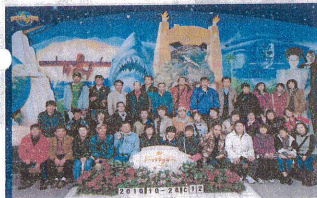
USJ ちょっと雨だったけど楽しかったなあ

10月28、29日、大阪旅行に行ってきました。一日目は、ユニバーサル・スタジオ・ジャパンでアトラクションを満喫。二日目は、フェリーに乗って海遊館へ。大きなじんべいざめに会いました。旅行で九州を出て飛行機に乗るのは久しぶり。ちよっぴりドキドキもしましたが、楽しい旅行となりました。