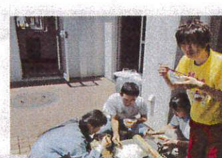
いっぱい流れ着いたよ