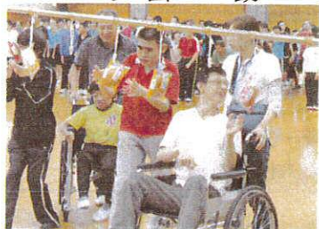
手で取ってるのはだ~れだ

6月26日、ウイングま、つばせで「すまいるフェスタ」がありました。午前はパン食い競争や大玉転がし、午後は簡単エアロビクスや缶つぶし等の種目があり、体を動かすいい機会になりました。