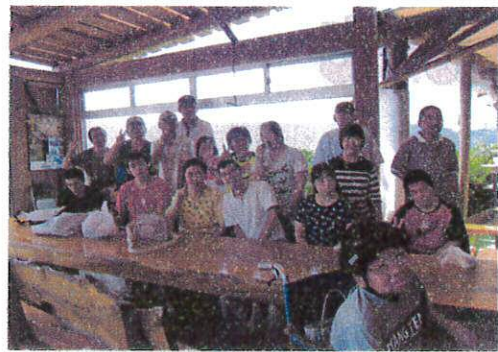
きれいな空気をたくさん吸いました