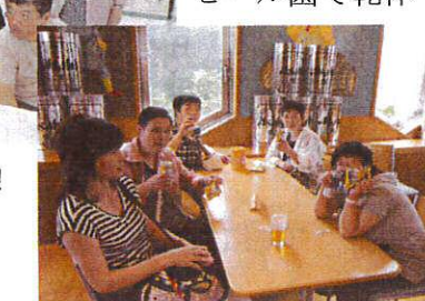
ロボットキティと!