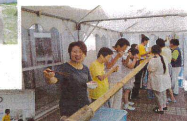
食べるのに必死です