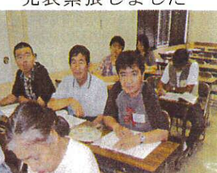
発表を聞きました