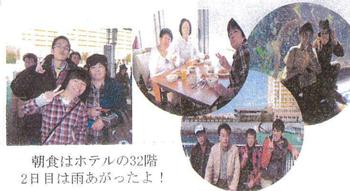
朝食はホテルの32階 2日目は雨あがったよ!