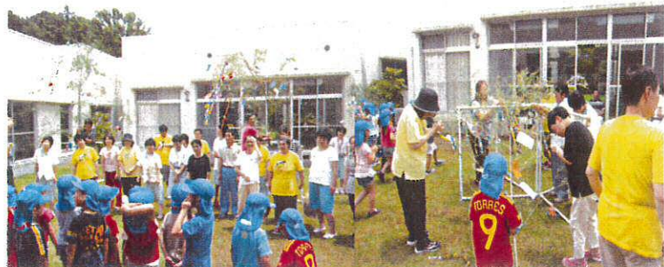
お互いに声掛け合いながら素敵な七夕飾りが完成!

7月7日、豊福保育園の子供たちと一緒に七夕の飾り付けをしました。それぞれ願い事を短冊に書き、思いを込めて飾り付けました。保育園の子供たちからのかわいい歌のプレゼントもあり、短い時間でしたが、一緒に楽しいひと時を過ごすことができました。