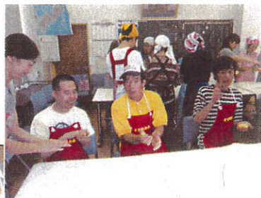
丸めるのは難しいな