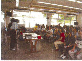
協会のお二方ありがとうございました