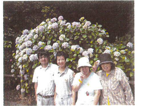
住吉へあじさい観賞