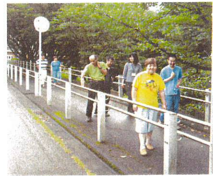
毎日の散歩は習慣になりました