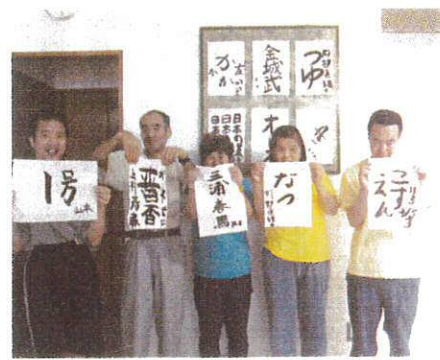
好きな文字を書きます 一文字一文字集中します