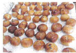
たくさんパンができました