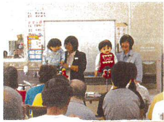
腹話術で楽しく学びました