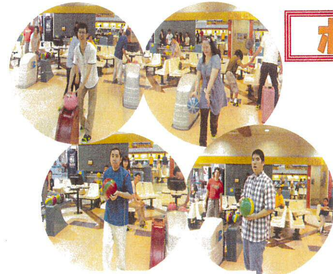
よーし、全部倒すぞ~!

7月2日、通所利用者のレクリエーションで宇土パスカワールドへボーリングに行きました。約1年ぶりに行くことあつて皆とても楽しみにしていました。 ボールの重さを決め、ガードー防止柵や補助器具を使うなど各々工夫し、ストライク目指してトライしました。各レーンで歓声が上がると、ハイタッチをするなどとても盛り上がり、ほどよく汗もかき楽しいひと時でした。