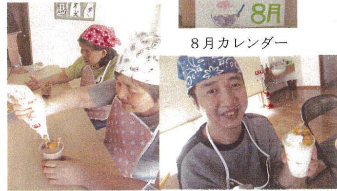
生クリーム真剣にのせます おいしそうなパフェでしょ

春号でも紹介しました生活介護班。現在利用者6名、支援員2名で活動しています。 朝の散歩から始まり、希望の里内を回ります。時には、柔軟体操に取り組み身体機能を維持・増強させます。また、手作りカレンダーを作成したり、書道や調理にも取り組んでいます。午後は、主に生産活動を行います。 今までは、生産活動中心で一日を過ごしていましたが、さまざまな活動を行うことで、何事にも意欲的に取り組む姿勢が少しずつ見られるようになり、毎日いきいきと過ごされています。